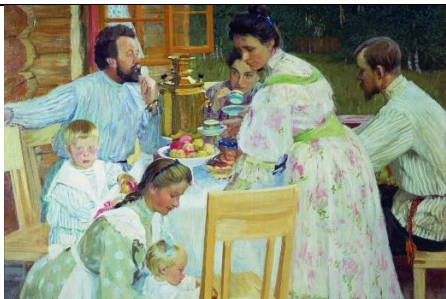
Б.М. Кустодиев «На террасе»