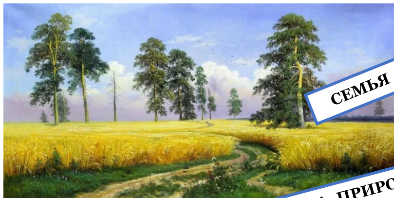
И.И. Шишкин «Рожь»*